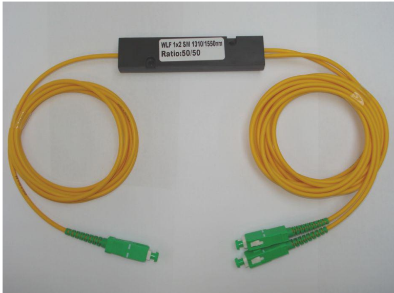
Optický rozbočovač 1:2