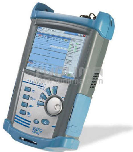
EXFO FTB-200 - optický reflektometer