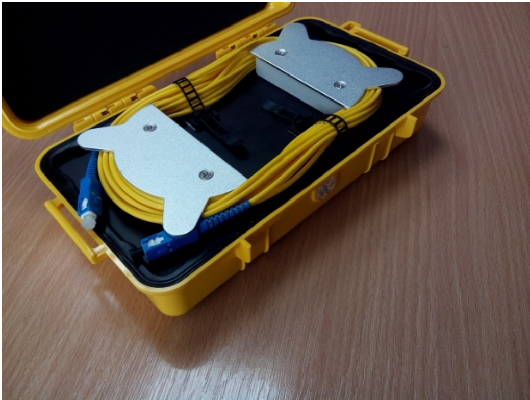
Navinuté predradené optické vlákno pre OTDR prístroje